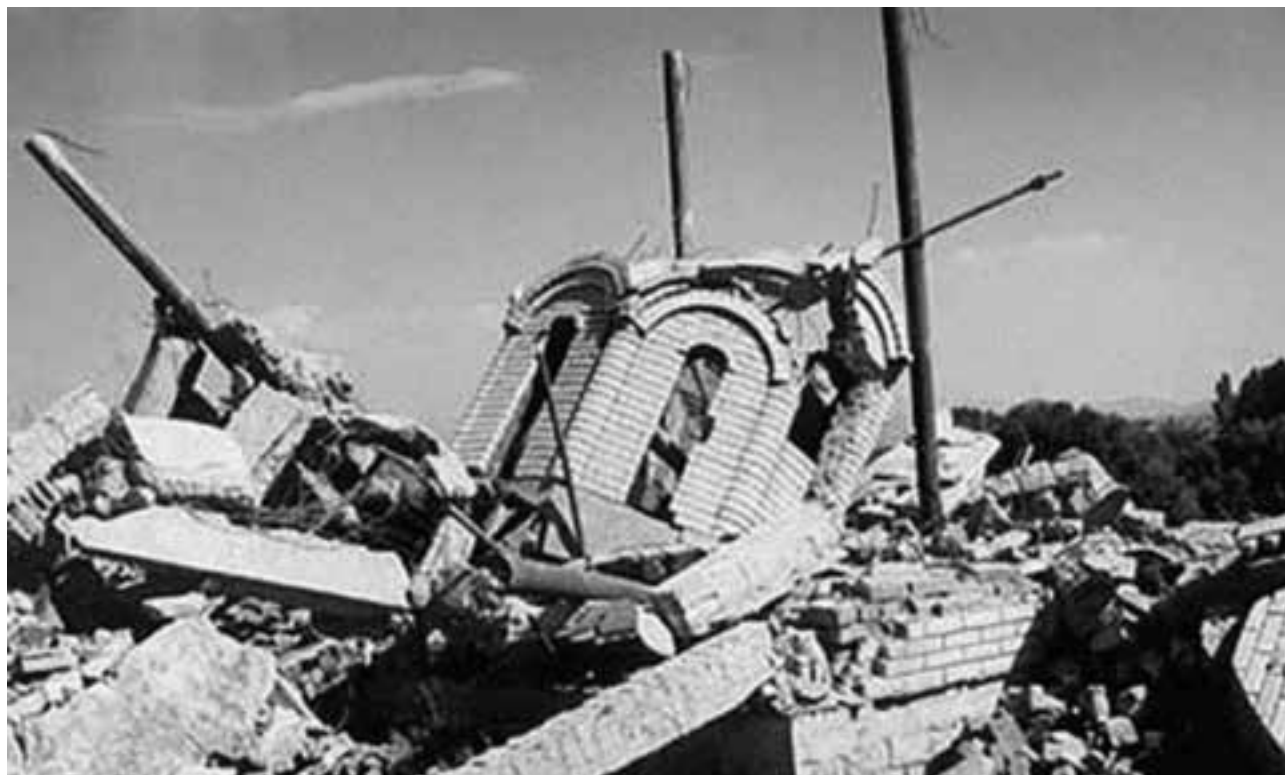
Слика 2 – Црква Свете Петке у селу Заскок код Урошевца