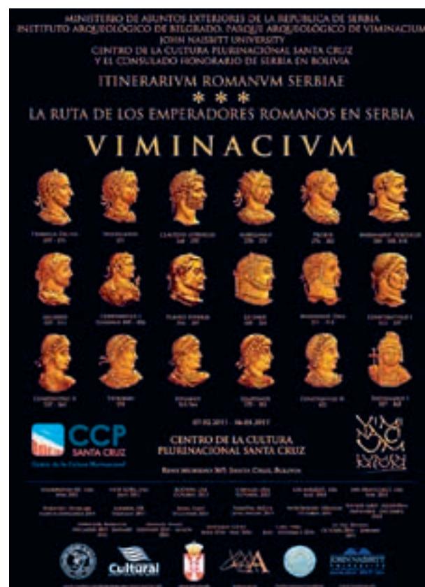
Слика 1 - Промотивни плакат са последње изложбе „Путеви римских императора у Србији“ приређене у Санта Круз де Сијери 2017. године [7]