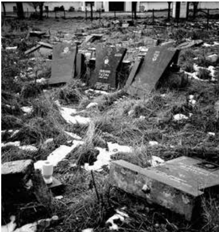
Слика 3 – Разрушено српско гробље у Вучитрну