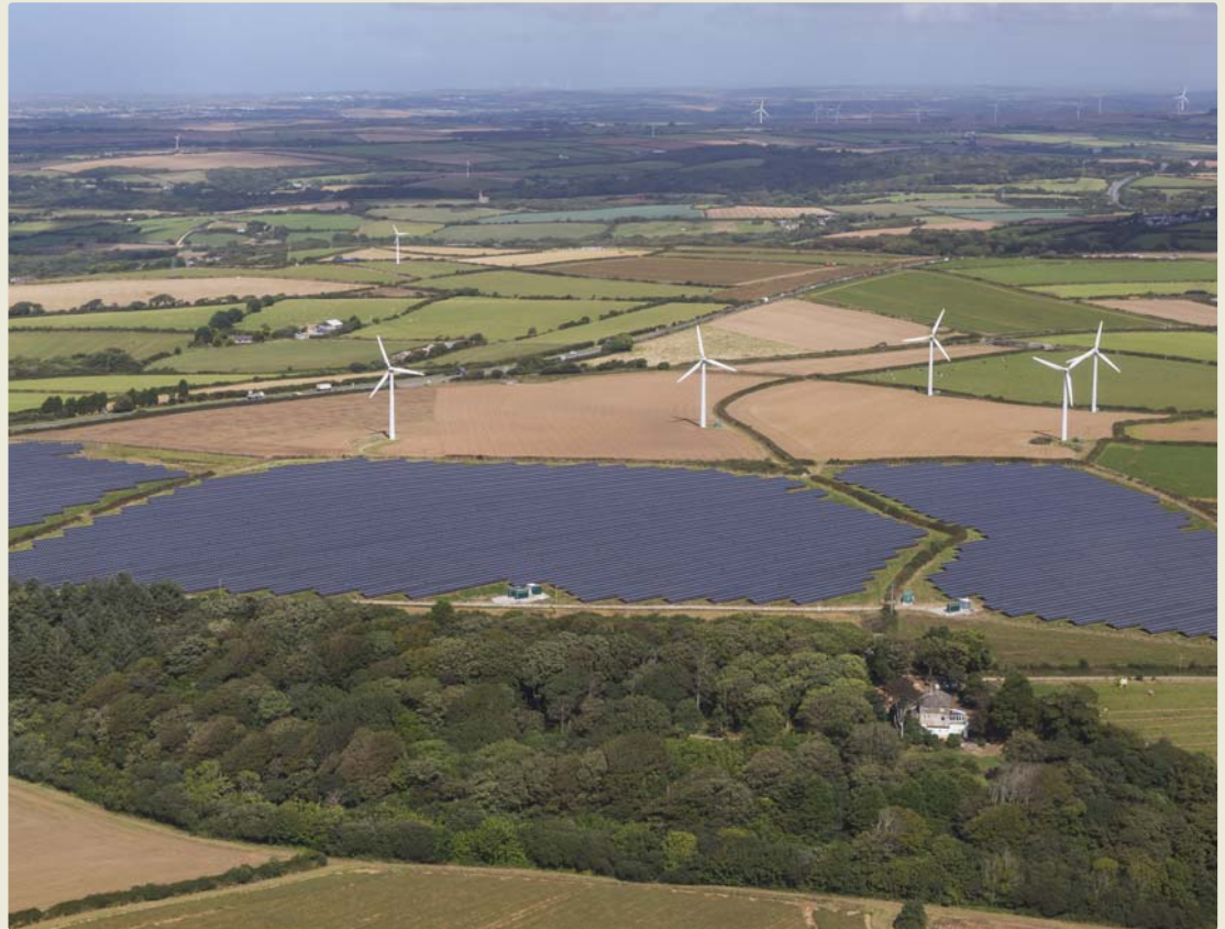
→ Ferme d'énergie solaire et éoliennes