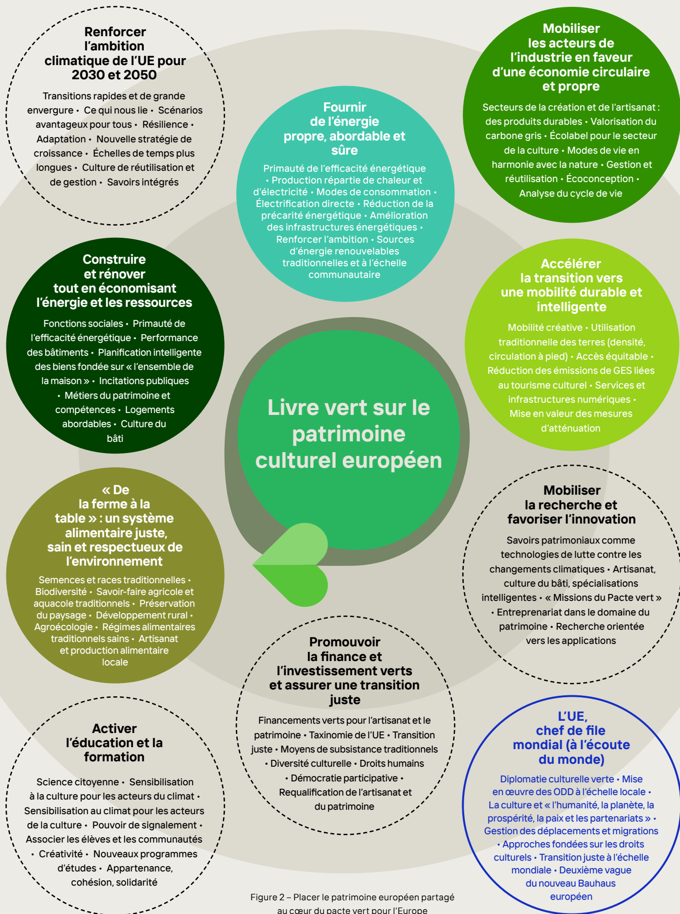
Figure 2 – Placer le patrimoine européen partagé au cœur du pacte vert pour l'Europe