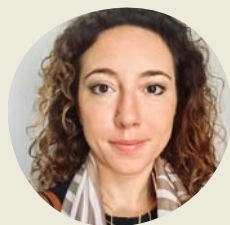
PAR ANTONIA GRAVAGNUOLO

INSTITUT DE RECHERCHE SUR L'INNOVATION ET LES SERVICES POUR LE DÉVELOPPEMENT, CONSEIL NATIONAL DE LA RECHERCHE, ITALIE