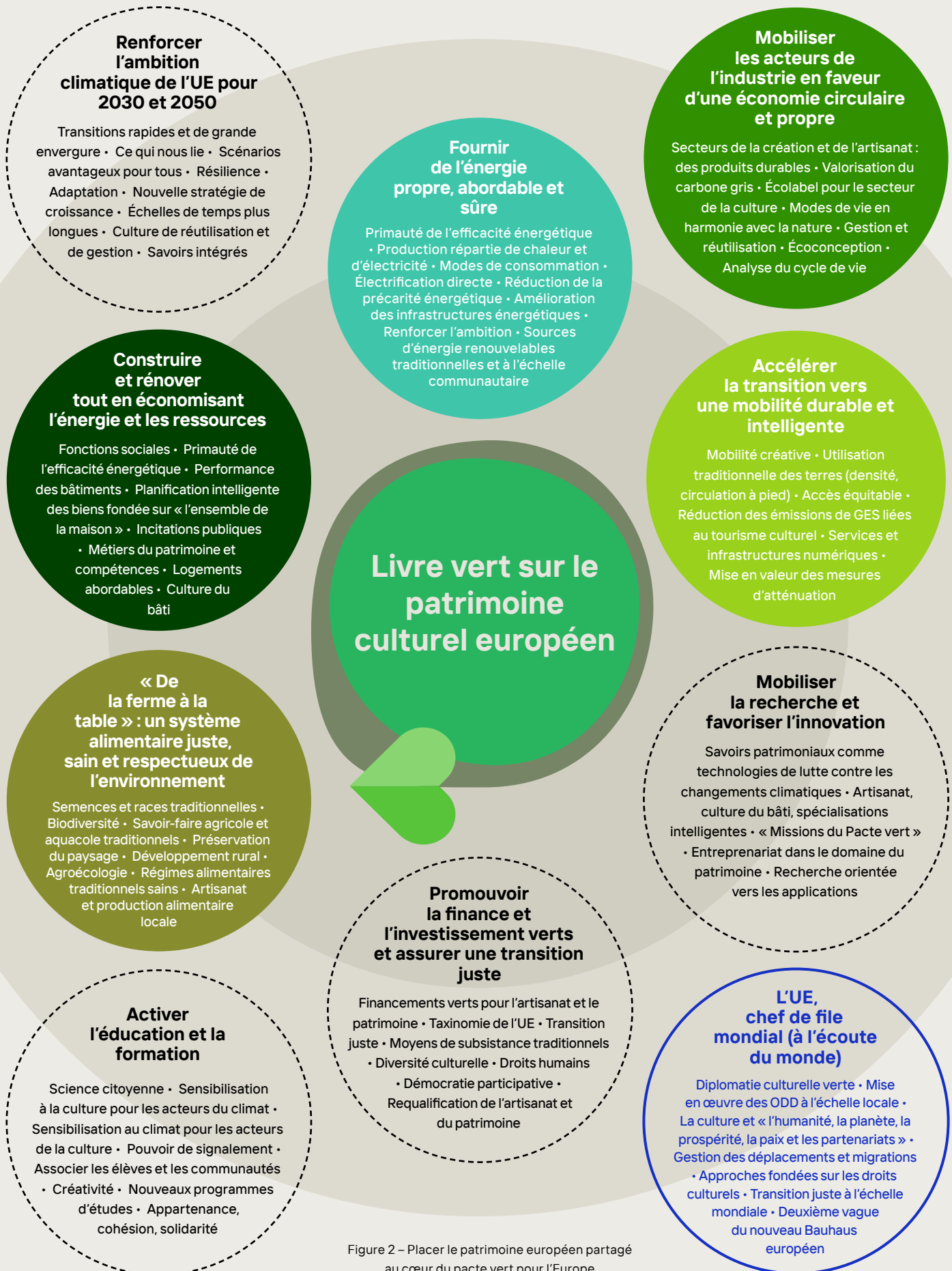
Figure 2 – Placer le patrimoine européen partagé au cœur du pacte vert pour l'Europe