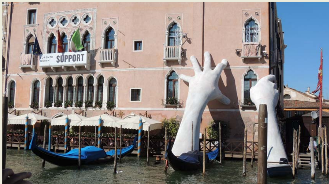
→ «Support» par Lorenzo Quinn, 2017

tuellement des répercussions sur le patrimoine culturel à l'échelle internationale. Les événements se produisant dans un pays ne peuvent et ne doivent pas être traités isolément par rapport aux autres pays ou continents. Malgré les progrès accomplis dans la compréhension de la relation entre les effets des changements climatiques et le patrimoine culturel, des obstacles aussi bien publics que privés, empêchent d'élargir le débat et d'apporter une réponse mondiale à cette question en ce qui concerne le patrimoine culturel.