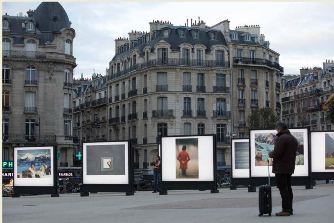
→ SNCF Gares & Connexions - Programme culture

des voyageurs. Le train est vu comme un moyen de transport écologique permettant également de faire tomber les barrières géographiques et sociales. La filiale s'engage à promouvoir l'égalité et la diversité. Démocratiser la culture en facilitant les moyens d'y accéder sur l'ensemble du territoire et préserver la valeur du patrimoine matériel et immatériel des gares figurent parmi ses interventions structurelles. Plus de 10 millions de voyageurs traversent chaque jour plus de 3 000 gares en France lors de leurs déplacements. De voyageurs à spectateurs, ils découvrent des œuvres d'art et des manifestations culturelles vivantes : expositions, concerts, conférences, festivals.