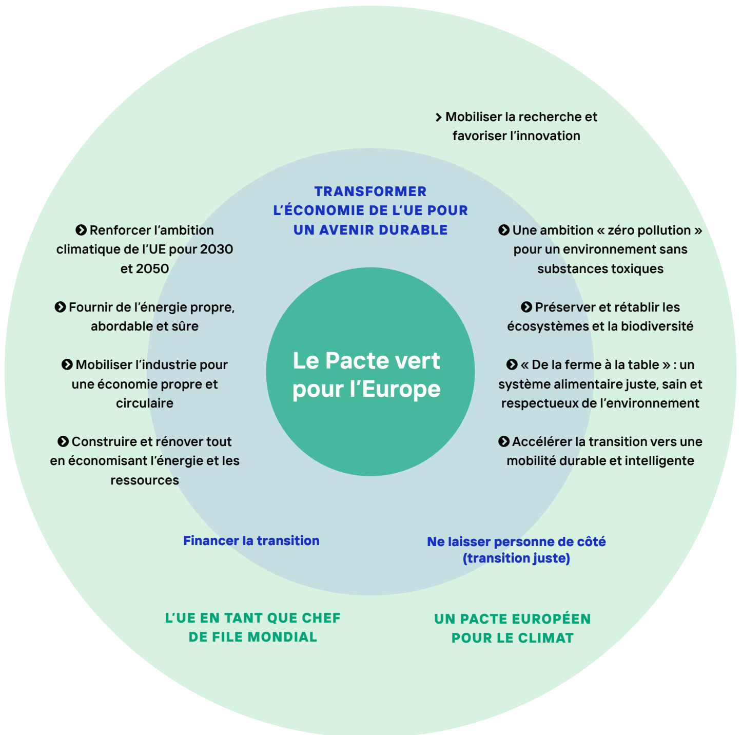
Figure 1 – Le pacte vert pour l'Europe.